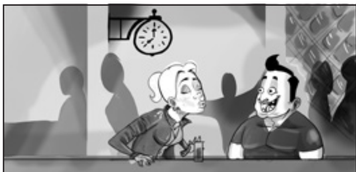
Scene: 1.2 Tid: 00:02:00

Ung, cool fyr står i baren, og tikkes om en "tår" vores karakter bliver stolt og vil gerne dele ud.