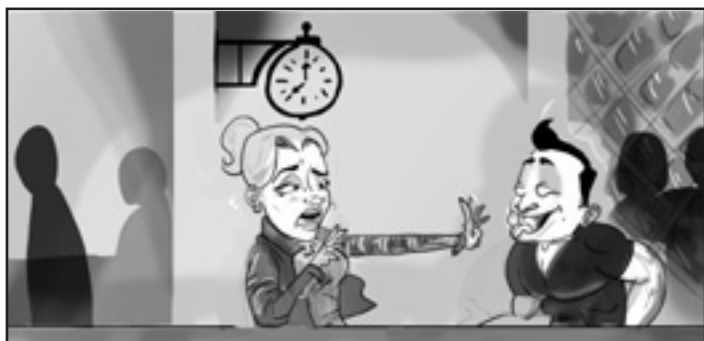
Scene: 3. Tid: 00:02:00