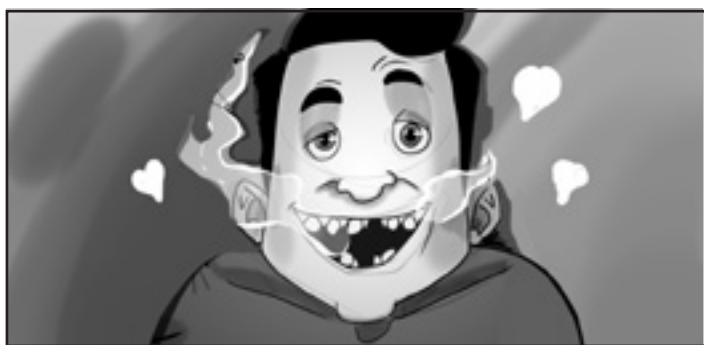
Scene: 2. Tid: 00:01:00

Som tak vil vores offer give et kys, MEN!